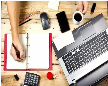
人文及社会经济学